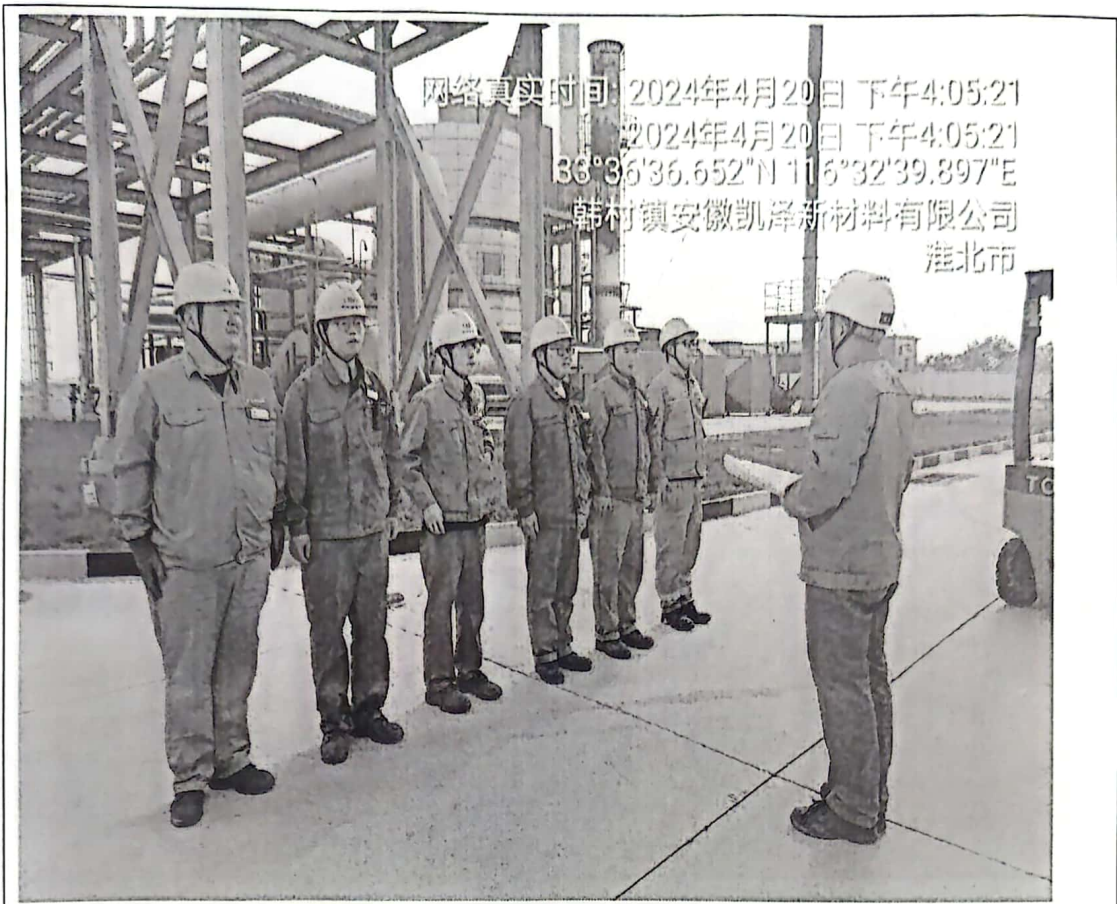
演练前讲解演练内容及应急响应步骤