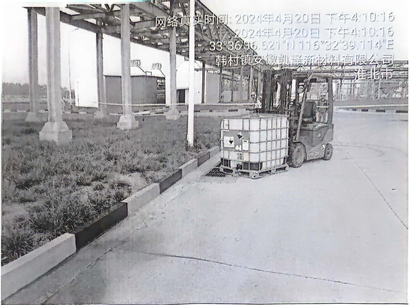
拉起警戒袋并作相应处理设施